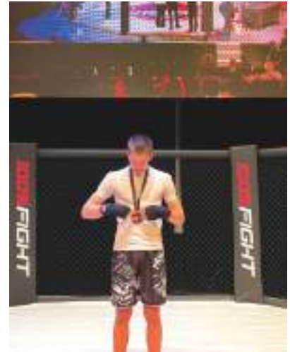
RAPH 100 FIGHT